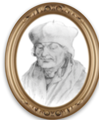
ERASMUS FRA ROTTERDAM: "MENNESKER FØDES IKKE, DE DANNES."